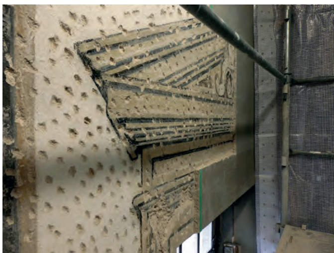
Wiederentdeckte Dekoration aus der Bauzeit in der Martinskirche von Montbéliard vor der Restaurierung

de in Riquewih von den Mitgliedern zur »Présidente honoraire«, zur Ehrenvorsitzenden, gewählt.