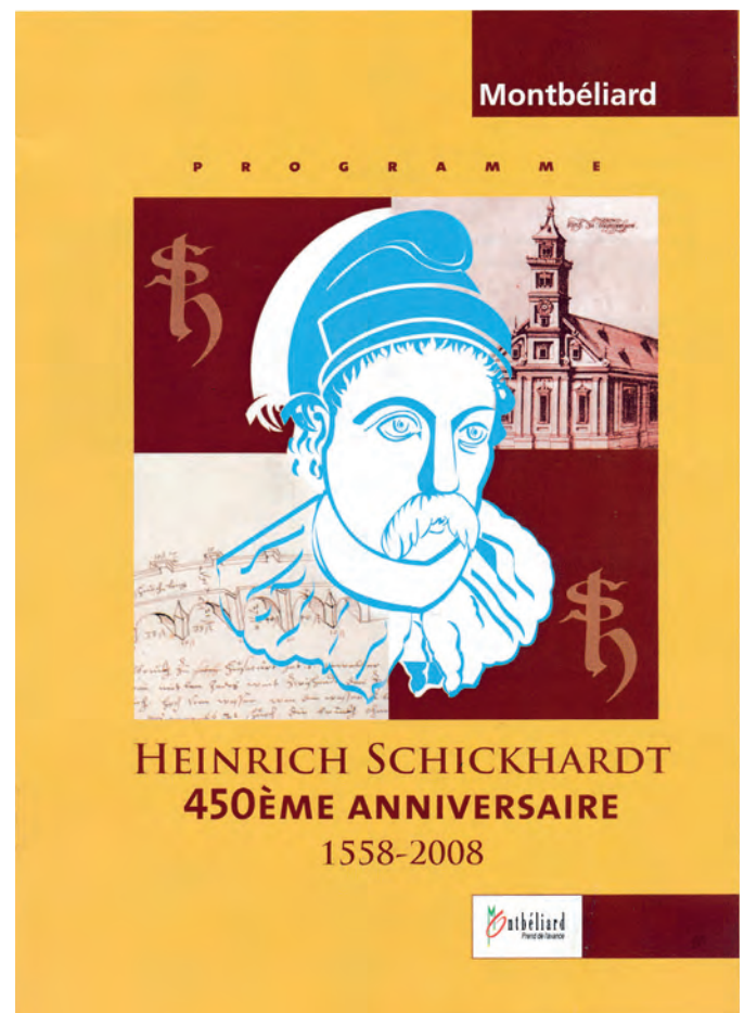
Faltdokument des Festprogramms in Montbéliard aus Anlass des 450. Geburtstags von Heinrich Schickhardt im Jahr 2008