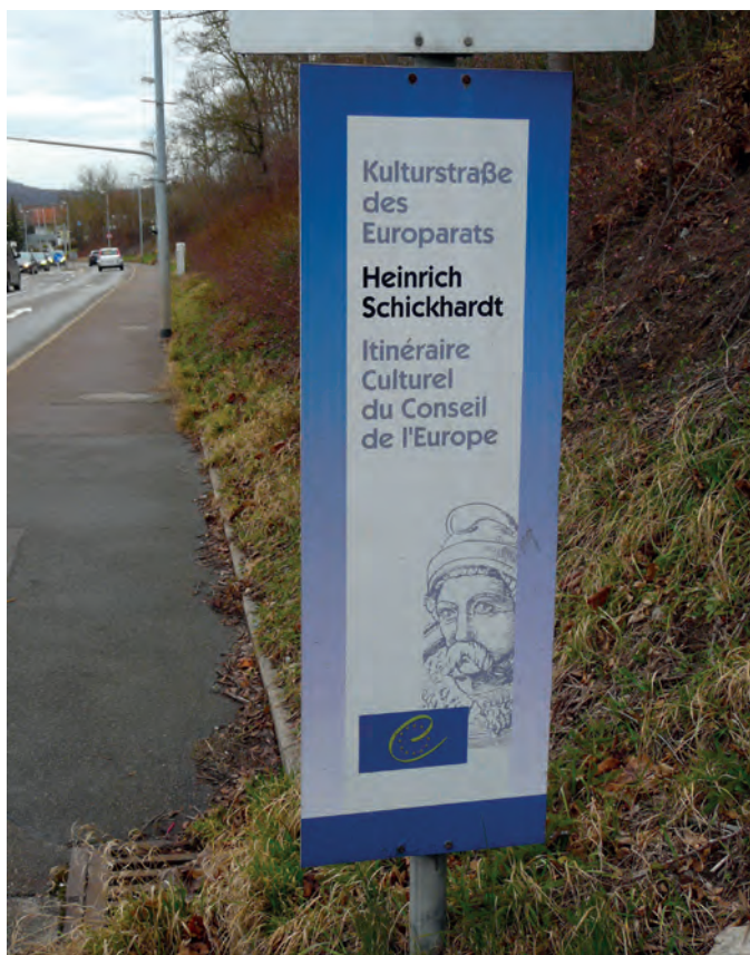
Hinweisschild zur Kulturstraße Heinrich Schickhardt in Leonberg