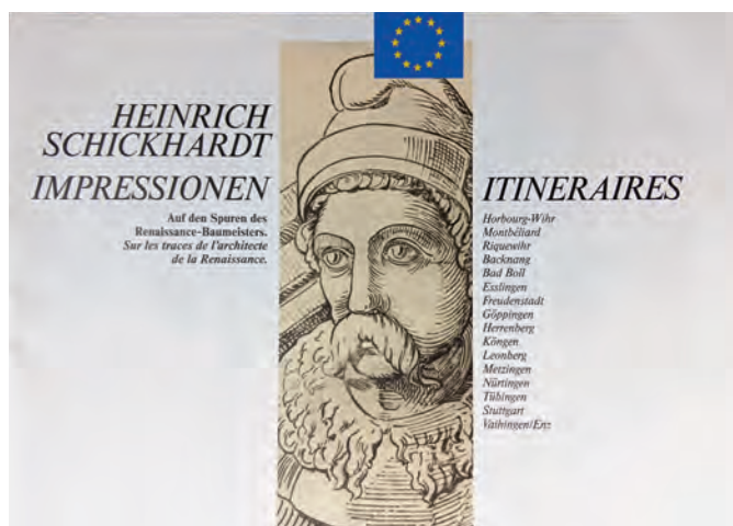
Titelblatt der ersten, zweisprachigen Schickhardt-Broschüre als Gemeinschaftswerbung von 16 Städten aus dem Jahr 1990