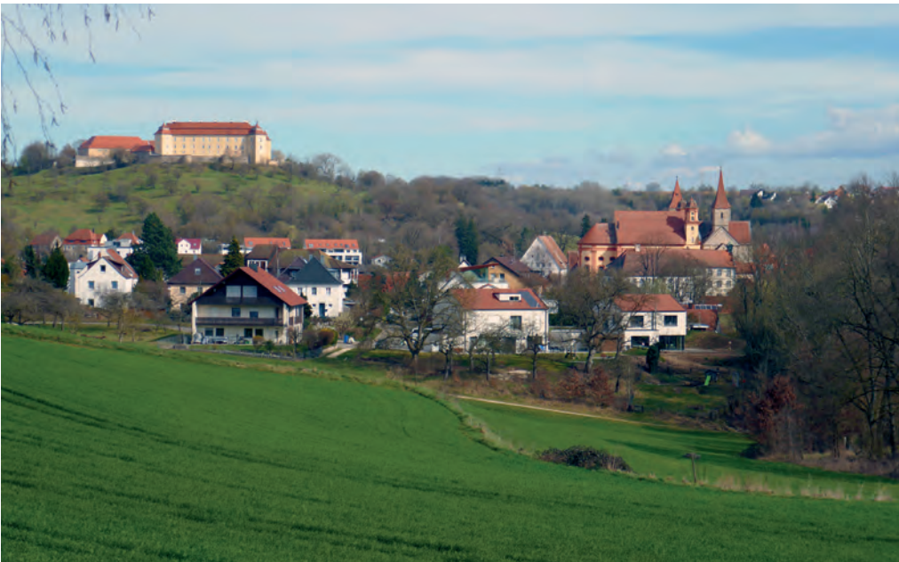
Blick auf Ellwangen

schließlich in den Mischwald des Galgenwaldes. Damit sind verschiedene Lebensraumtypen tangiert, die ein vielfältiges Vogelleben erwarten lassen. Die Aussicht auf eine reichhaltige Artenliste wurde 1939 nicht enttäuscht. Bernhard Wolf hat die gehörten und/oder gesehenen Arten zu einem ansprechenden Text verarbeitet. Die Schilderung der Wanderung und der erlebten Vogelwelt ist keine wissenschaftliche Arbeit, es handelt sich vielmehr um Notizen naturkundlich interessierter Personen, die Freude an der Vogelwelt hatten, aber nicht einmal ein ordentliches Fernglas und schon gar kein Vogelbestimmungsbuch bei sich trugen, geschweige denn eine »Orni-App«. Man muss also über ein paar Unzulänglichkeiten hinwegsehen, dennoch besteht kein Zweifel, dass die fünf Brüder auf ihrer Morgenwanderung insgesamt +/- 44 Vogelarten erkannt und notiert haben.