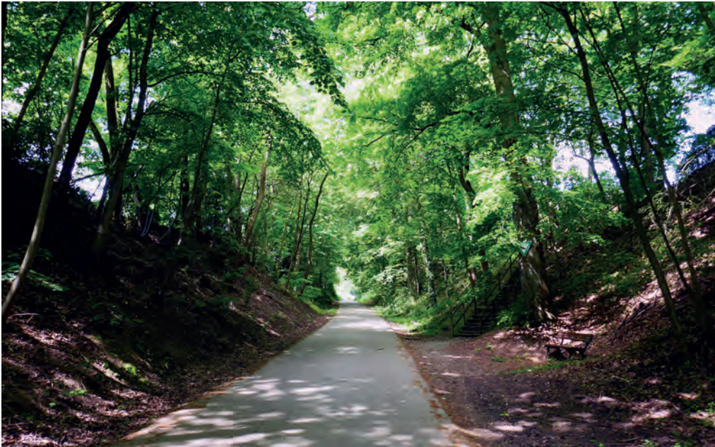
Der Nibelungenweg, ein tiefer Hohlweg am Stadtrand