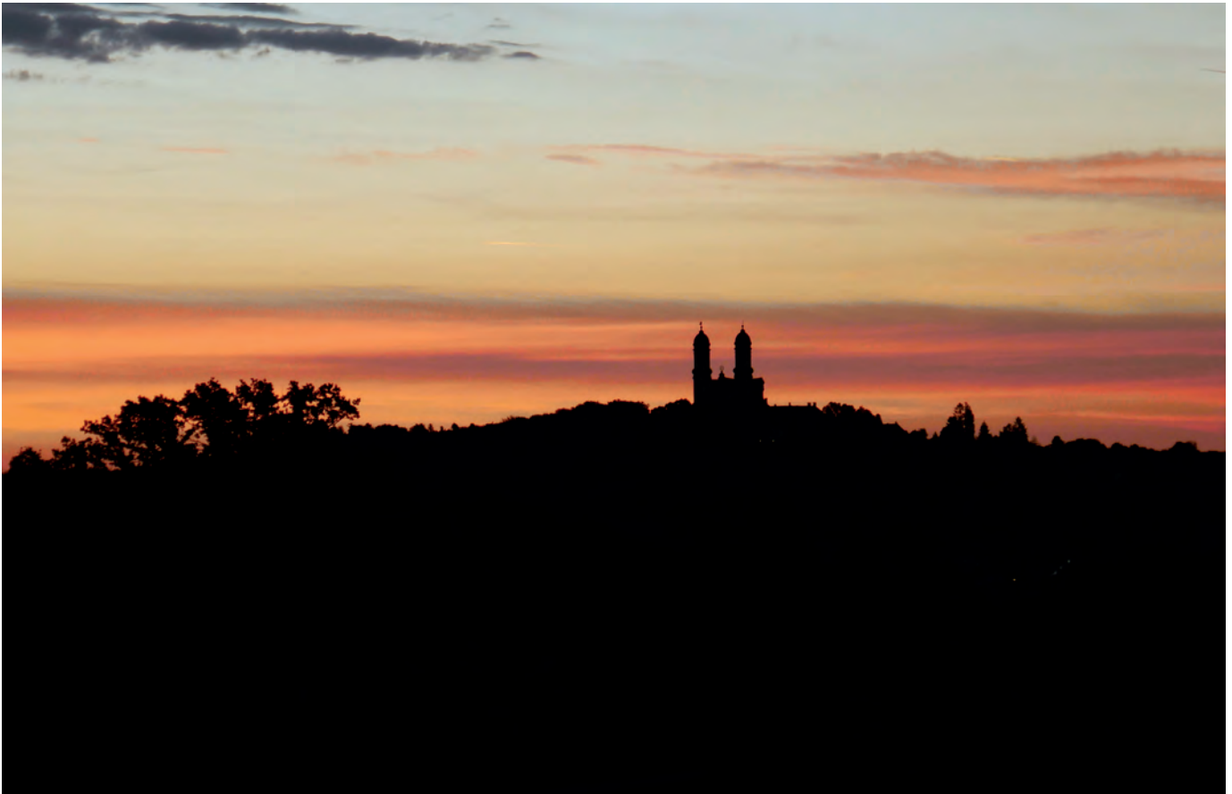
Sonnenaufgang bei Ellwangen über dem Schönenberg mit der berühmten Wallfahrtskirche