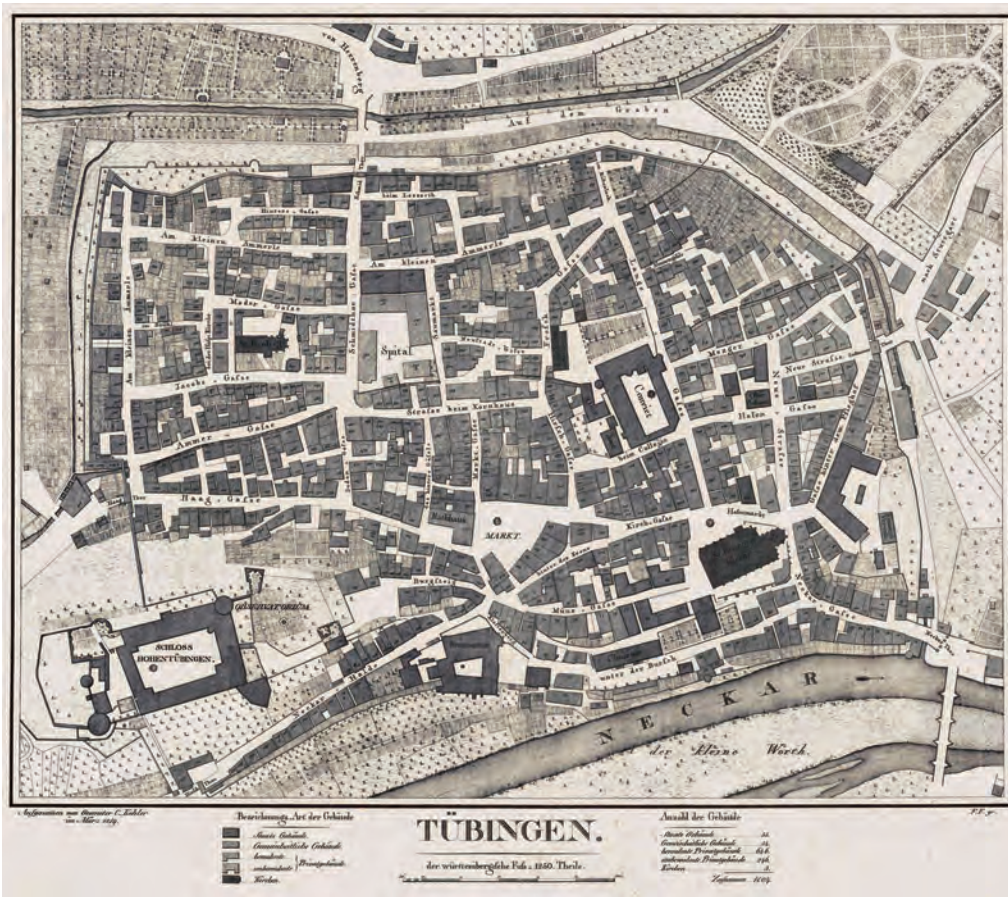
Urkarte / erster Stadtplan Tübingens 1819 mit Markierung Pfleghofkeller und Stiftsfruchtkasten: Der Bebenhäuser Pfleghof ist am rechten Kartenrand an der Straße Hinter dem Pfleghof. Der Stiftsfruchtkasten ist am oberen Kartenrand das Gebäude links vom Schmiedtor.