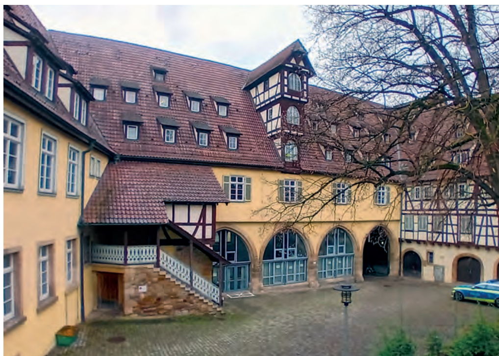
Der Innenhof des Bebenhäuser Pflegehofs