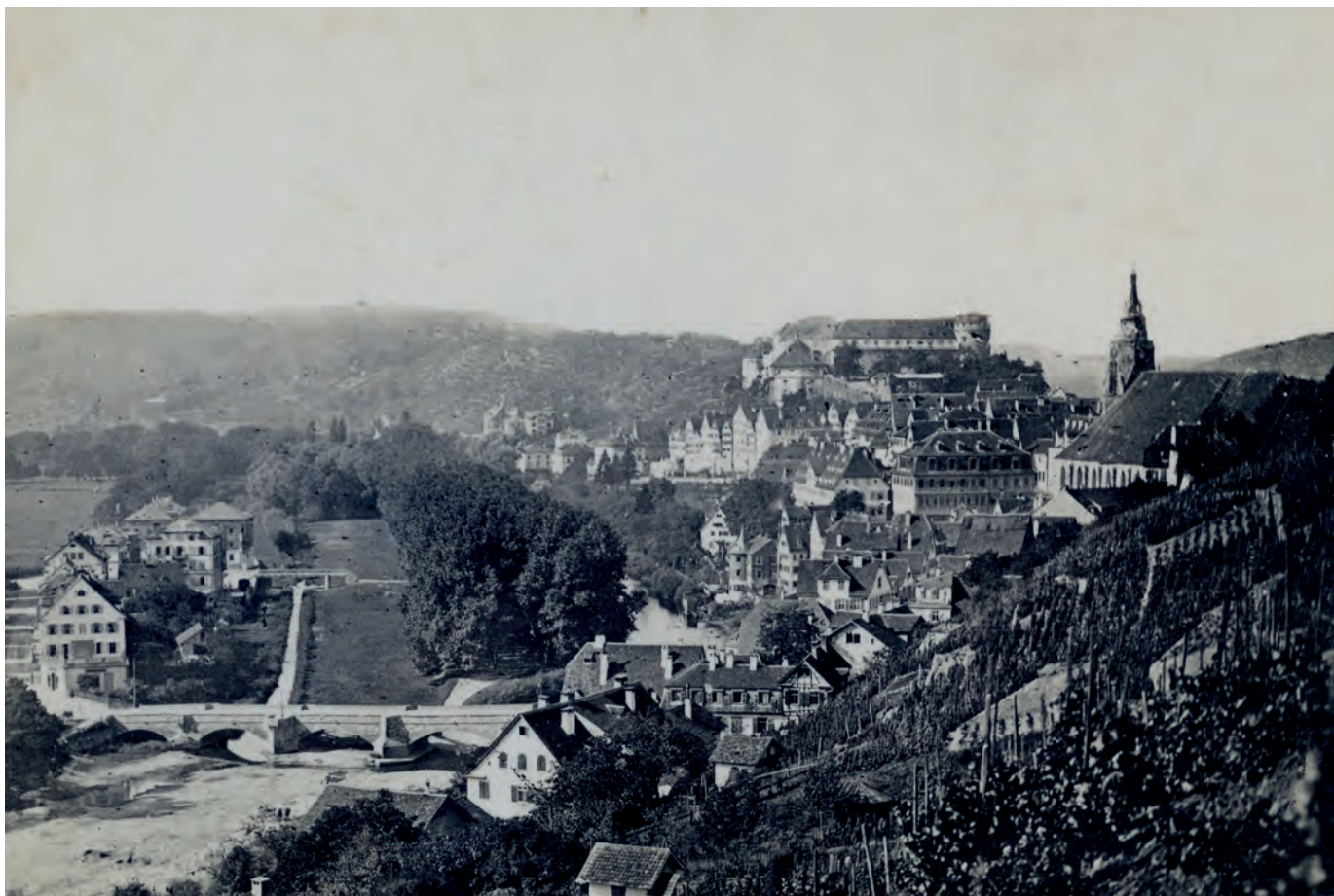
Die Weinberge im Vordergrund lagen auf dem Österberg um 1876