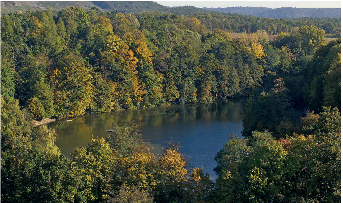
Der Tiefe See wurde zur Wasserversorgung direkt oberhalb des Klosters angelegt. Die ursprüngliche Wassertiefe betrug 7 Meter, heute sind es noch 3,5 Meter.

Die Methoden haben sich seither weiterentwickelt und verfeinert, das Material – Sedimente und Torfe – ist mehrheitlich geblieben, teilweise aber durch menschliche Eingriffe wie Entwässerung, Baumaßnahmen oder Landwirtschaft zerstört und verloren gegangen. Erschlossen wird