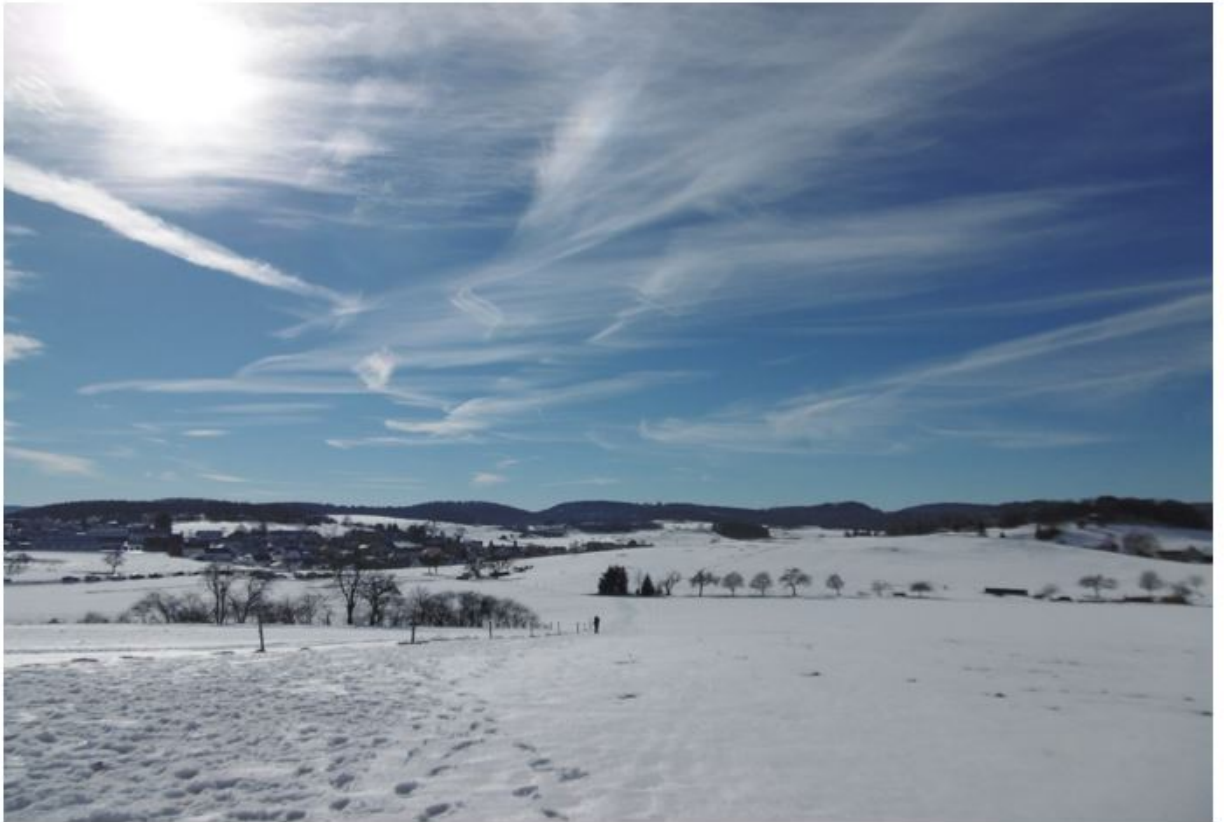
74 Darstellung 2: Im Augenschein gefertigtes Lichtbild Nr. 2: Blick auf das Schloss Lichtenstein von oberhalb der Anhöhe am Ortsrand von Holzelfingen (Straße Richtung Ohnastetten).