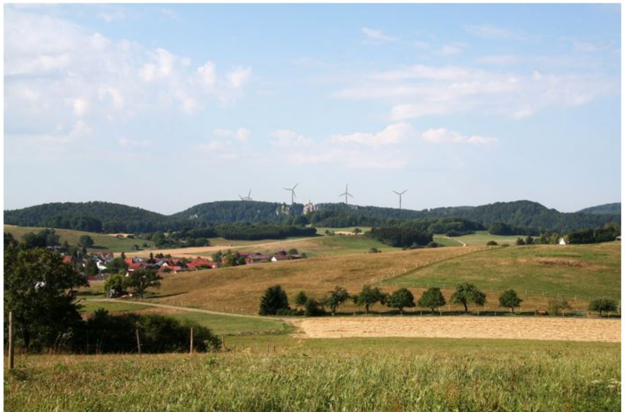
75 Darstellung 3: Visualisierung Nr. 01 im Genehmigungsantrag der Klägerin: Holzelfingen.