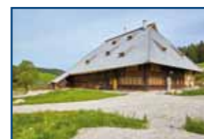
Kienzlerhansenhof Schönwald im Schwarzwald | 1591